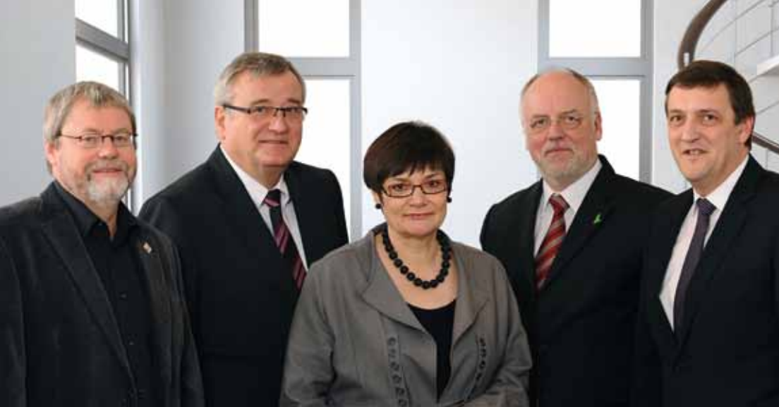
Das ist der Vorstand der BAG:WfbM. Die Chefs vom Verein.

In der normalen Arbeits-Welt gibt es nur wenige Arbeits-Angebote für behinderte Menschen. Die Chancen für behinderte Menschen sind immer noch schlecht. Daran hat sich in den letzten Jahren nicht viel geändert.