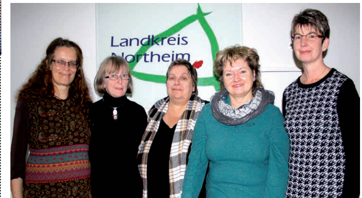
Familien-Hebammen im Land-Kreis Northeim